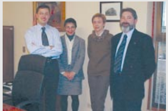
El Equipo de Dirección Financiera de Eurotools

La renovación o ampliación de nuestra gama de herramientas en productos tan diversos como alicates, tornillos de banco, carracas, vasos, paletas, herramienta de carpintería y construcción, así como los planes de inversión en maquinaria que superan los 2 millones de euros, nos permitirán lograr una mayor satisfacción de las necesidades del usuario de nuestra herramienta, a la par que una mayor