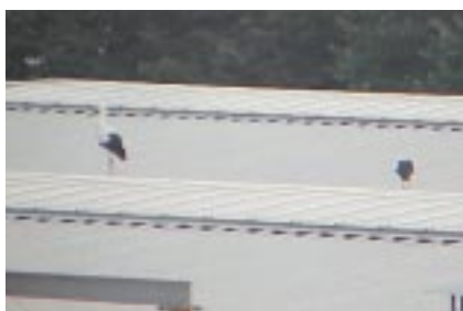
Una pareja de cigüeñas en el tejado de la planta de Irún.

Eurotools trabaja también desde hace años en el desarrollo de envases ecológicos tales como "blisters" de PET y cartón, perfectamente separables para su reciclado por separado, "clips" de material plás-