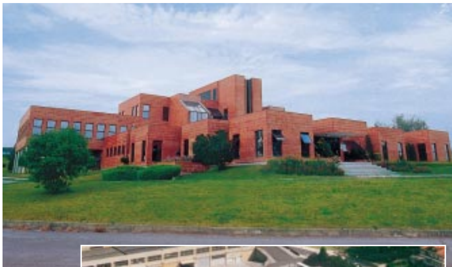
La planta de Irún (en la fotografía de la derecha.), y una vista de las instalaciones de Eurotools en Vitoria-Gasteiz (arriba).

Las mejoras medioambientales introducidas por Eurotools comenzaron antes de 1999 con la instalación de depuradoras para el tratamiento de vertidos líquidos, aceites y taladrinas, así como sistemas de extracción y lavado de gases nocivos. La empresa ha continuado en esta dirección con la incorporación de una línea de baño de níquel-cromado más inocua.